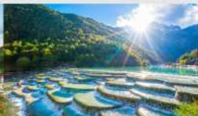
ทะเลสาบไป๋สุ่ยเหอ