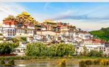
วัดลามะชงจันหลิน